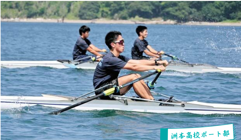
洲本高校ボート部