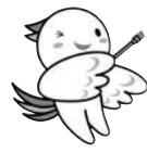
フェニックスサポーターはばタン