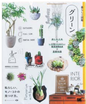
『グリーン』 著者：境野隆祐

本書では、植物をもっと楽しむ暮らし方のコツや、定番の物から現代風の物まで、今取り入れたい64種の観葉植物が掲載されています。