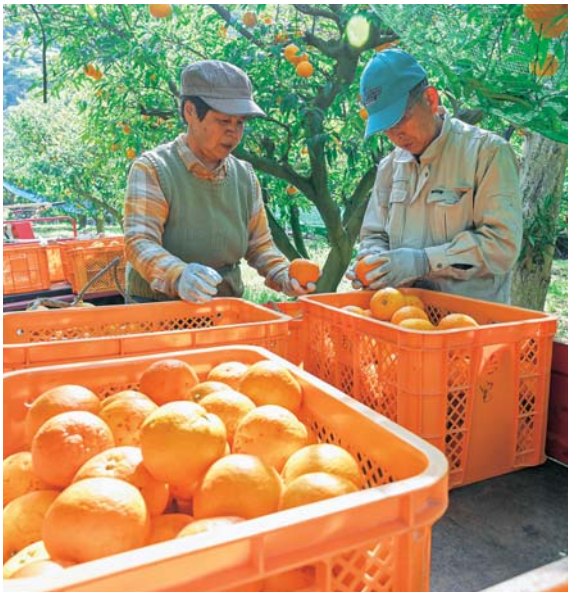
▲採れた果実の良し悪しを判別する2人。「これはどうや」「大丈夫やろ」という掛け合いが微笑ましかったです。