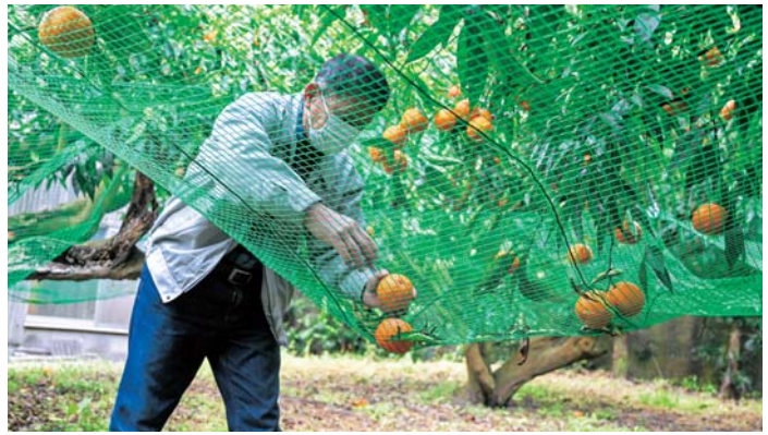
▲落果対策にネットを付けたら収穫も楽になったそうです。