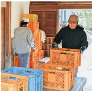
▲収穫したら汚れをとるために、ひとつひとつ丁寧に拭いていきます。自然の恵みを大切に包みこみながら。