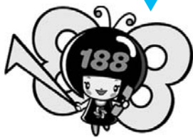
消費者庁 消費者ホットライン188 イメージキャラクター「イヤヤン」