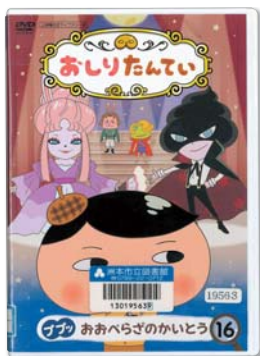
おしりたんてい DVD16巻 プップ おおぺらざのかいとう 原作：トロル

子どもたちに大人気、スイート ポテトがだいすきな「おしりたんて い」がプップとみっつのなぞをか いけつします。ただし、それには あなたのすいりがひつよう!最新 DVDはおおぺらざがぶたいだよ。 児童室にはおしりたんていの絵本 や読み物もいっぱい。