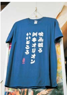
お客さんが作ってくれた というオリジナルTシャツ

大正時代からこの場所は、まちの人に楽しんでもらうために存在してきました。そして、まちの人たちもいつまでもこの場所があり続けてほしいと願っています。