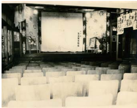
芝居小屋だったときは地域の人たちの交流の場にもなっていたそうです

詳細な時期は不明ですが、元々は大正時代から人形浄瑠璃を上演している芝居小屋として存在していました。その芝居小屋は「昭