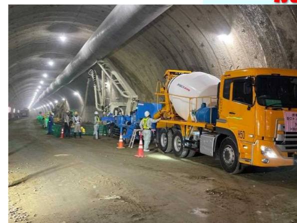
インバート打設状況