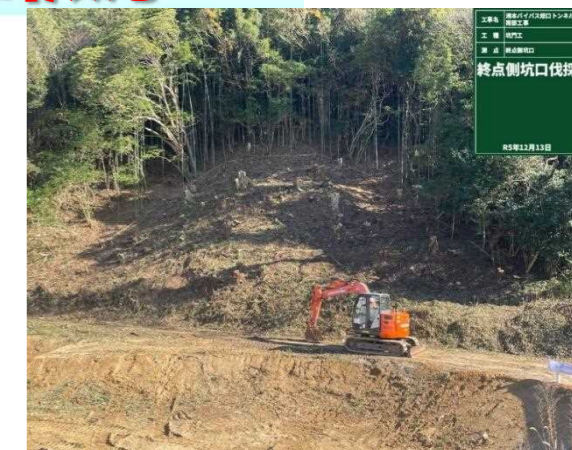
宇山側坑口 伐採状況