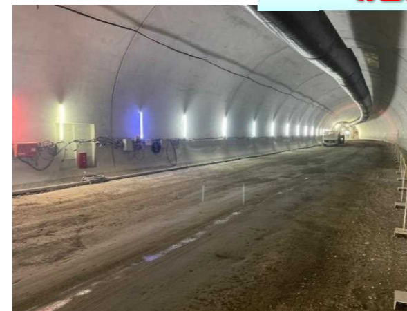
覆工コンクリート完了状況