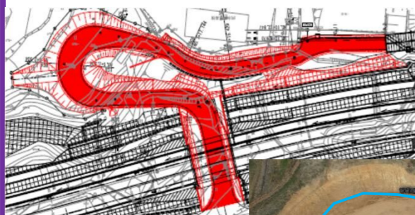
宇山B地区 現況写真（撮影日：R6.1.22）