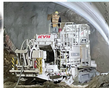
トンネル切羽 機械掘削状況