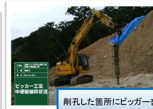
削孔した箇所にビッカーを差し込み、油圧で押し広げ、振動や騒音もなく割岩を行います