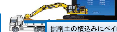
掘削土の積込みにペイロードメータを使用し、一台毎の重量管理を行って過積載を防止しています

ダンプトラックの運搬土量を最大化するペイロードメータ NEW PC200L-11はタブレットによる簡単な操作で、バケットで掘削した土の重量の表示と、ダンプトラックへの積載重量の管理ができます。 ※アームクレーン仕様のみの機能です。 ※タブレットおよび取り付けアタッチメントは付属していません。