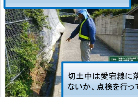
切土中は愛宕線に落石や異常がないか、点検を行っています

発注者：国土交通省近畿地方整備局 兵庫国道事務所 洲本維持出張所 ☎0799-22-1680