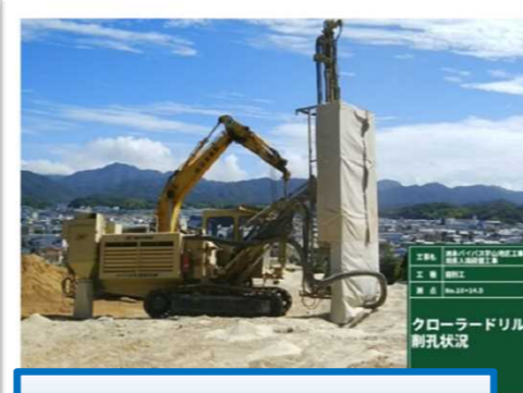
中硬岩の割岩の施工状況です。まずクローラドリルで削孔します