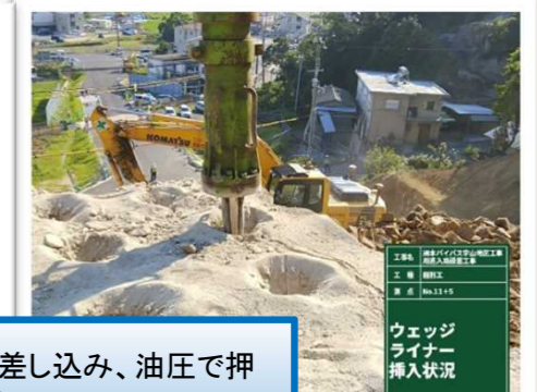
ウェッジライナー挿入状況

ダンプトラックの運搬土量を最大化するペイロードメータ NEW PC200L-11はタブレットによる簡単な操作で、バケットで掘削した土の重量の表示と、ダンプトラックへの積載重量の管理ができます。 ※アームクレーン仕様のみの機能です。 ※タブレットおよび取り付けアタッチメントは付属していません。