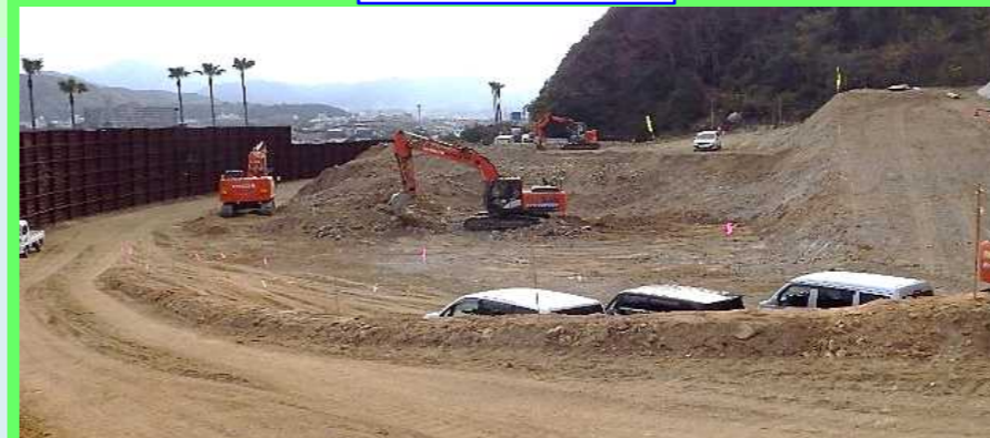
第2法面 吹付砕施工状況