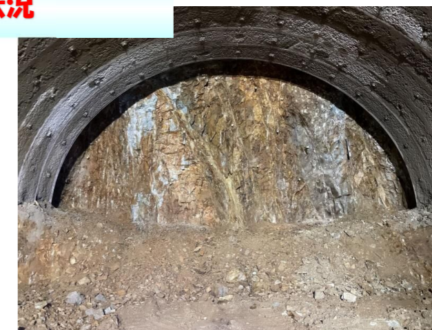
トンネル切羽状況