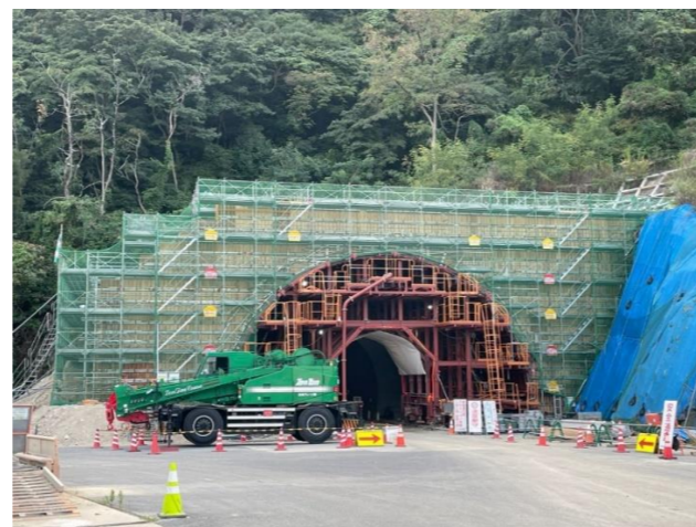
起点側(炬口)坑門工施工状況