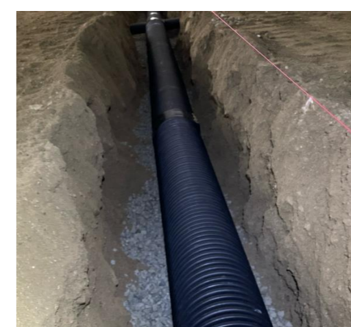
地下排水工施工状況