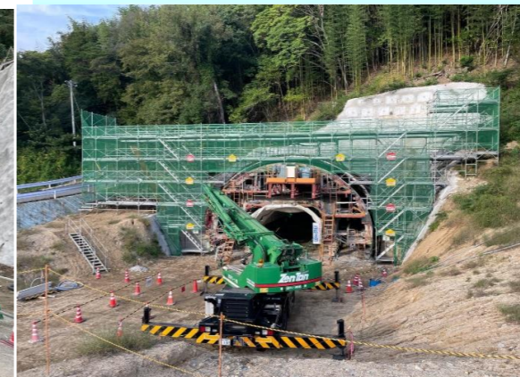
終点側(宇山)坑門工