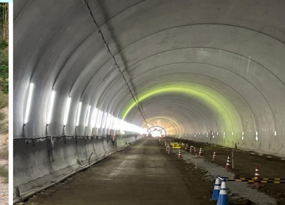
坑内状況(中間部から終点を望む)