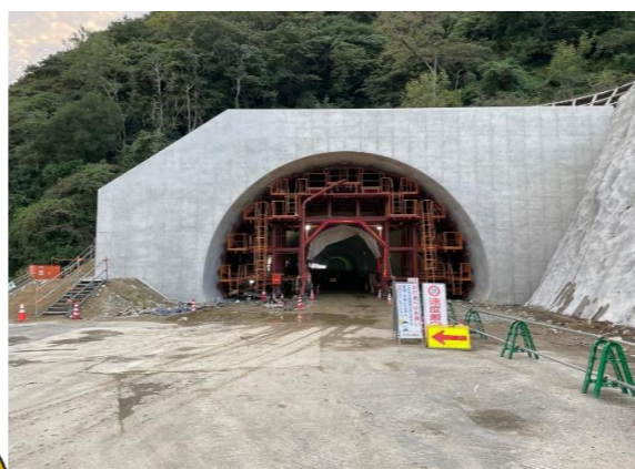
起点側(炬口)坑門工