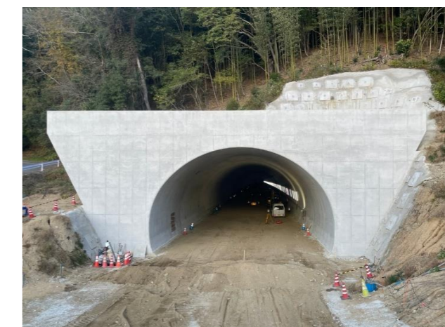
終点側(宇山)坑門工