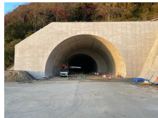
起点側(炬口)坑門工